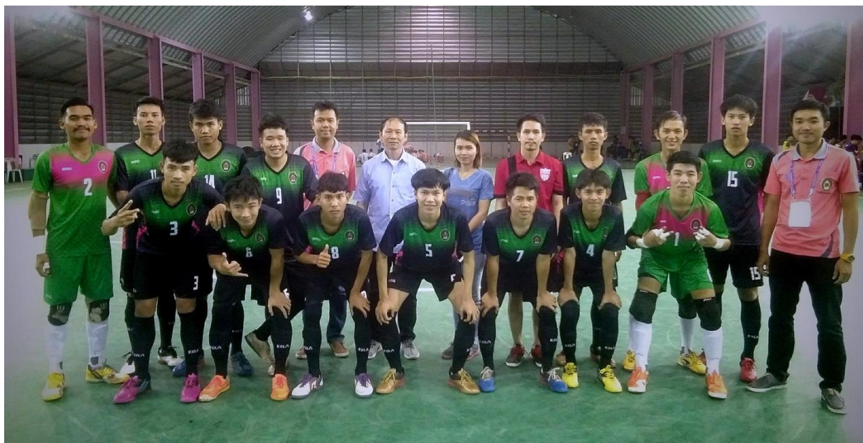
ประมวลภาพการแข่งขันกีฬามหาวิทยาลัยแห่งประเทศไทย ครั้งที่ 45 รอบคัดเลือกภาคตะวันออกเฉียงเหนือ