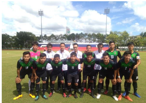
ประมวลภาพการแข่งขันกีฬามหาวิทยาลัยแห่งประเทศไทย ครั้งที่ 45 รอบคัดเลือกภาคตะวันออกเฉียงเหนือ