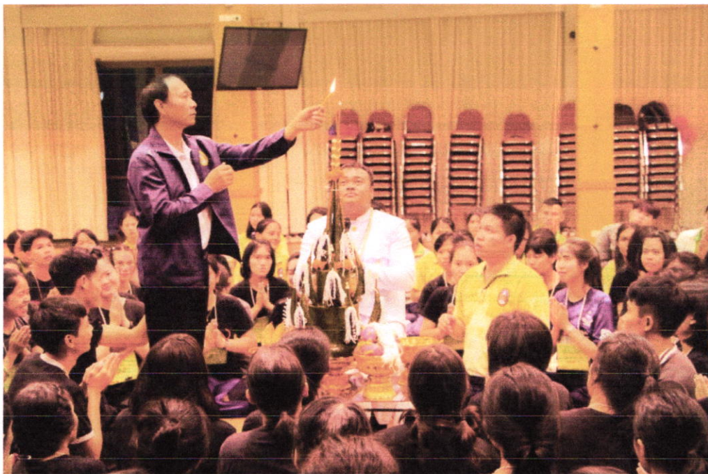
พิธีบายศรีสู่ขวัญนักศึกษาใหม่