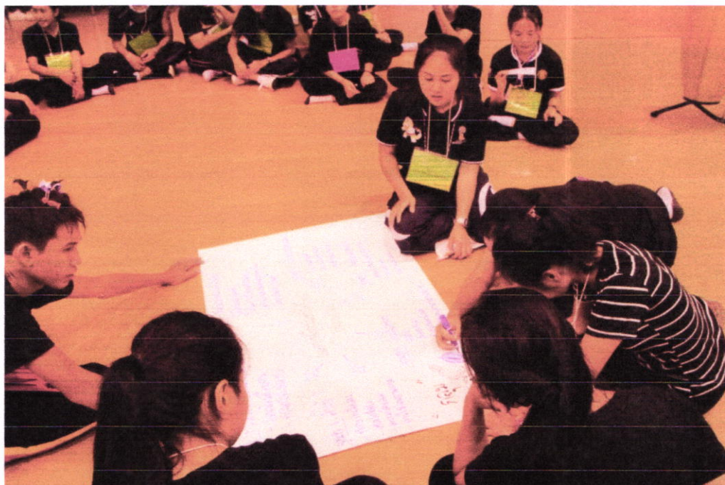
กิจกรรมถอดบทเรียนจากกิจกรรมเข้าฐาน